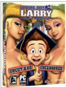
Seksualiteit in games: Leisure Suit Larry

is echter veel sterker het geval bij videoclipps of films dan bij games. De in de media getoonde seksualiteit kan jongeren beïnvloeden in hun gevoelens, kennis over seks, en hun houding en gedrag, maar eenduidige resultaten hierover zijn er niet binnen wetenschappelijk onderzoek. Een rechtstreeks verband tussen beelden in de media en gedrag van jongeren is nooit aangetoond. Net als bij geweld kan er wel sprake zijn van gewenning bij het zien van beelden van seksualiteit. De omgeving, dus ouders, school en vrienden, speelt een veel grotere rol bij het gedrag van jongeren dan de media. Daarom is in dit verband goede seksuele voorlichting van belang.