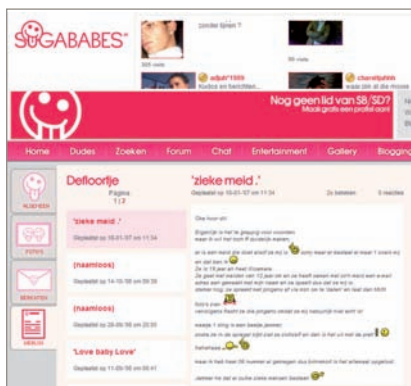
Weblog op www.sugababes.nl

Het is niet zo dat deze vrijheden op internet tot gevolg hebben dat jongeren er maar op los fantaseren. Uit onderzoek blijkt dat jongeren meestal dicht bij de werkelijkheid blijven in hun blogs. 76 Toch zie je dat zij in blogs de speelruimte vinden om uit te komen voor wie ze werkelijk zijn. Zo blijkt dat jongens in blogs vaker uit durven komen voor hun seksuele geaardheid dan in de reële wereld. Het spelen met de identiteit is dus niet altijd het aannemen van een andere identiteit (hoewel dat ook gebeurt) maar een betere, mooiere of eerlijkere identiteit.