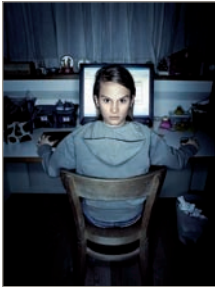
De campagne stop digitaal pesten

durf meer met MSN, je bent niet bij hem en hij kan je niet in elkaar slaan”. 95 De derde reden is miscommunicatie: online-ruzies ontstaan vaak omdat jongeren elkaar verkeerd begrijpen en omdat het moeilijk is nuances aan te brengen bij online-communicatie.