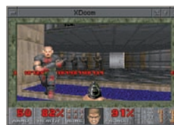
DOOM: een voorbeeld van een gewelddadige game

Geweld in games zorgt voor een levendige maatschappelijke discussie. 174 Toenemend geweld in de samenleving zou onder andere het gevolg zijn van gewelddadige computergames. Het is veel te kort door de bocht om de games er daadwerkelijk de schuld van te geven. Games vormen maar een klein onderdeel van de media. Daarnaast zijn er vele andere zaken die kunnen bijdragen aan een toename van geweld, zoals een verbrokkelende samenleving, de thuissituatie, persoonlijke eigenschappen of foute vriendschappen.